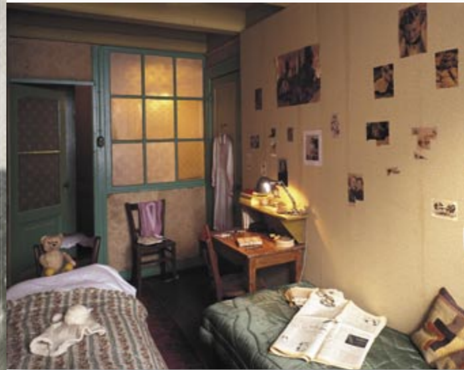
Dit is het kamertje van Anne Frank in het achterhuis. Eerst deelt ze het met haar zus Margot, later met Fritz Pfeffer. Margot slaapt dan bij haar ouders op de kamer.