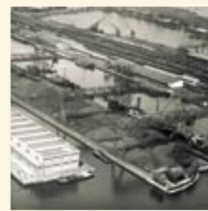
Op het haventerrein kwamen treinen aan met kolen. Nu staan er woningen.